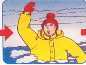
Не паниковать, позвать на помощь